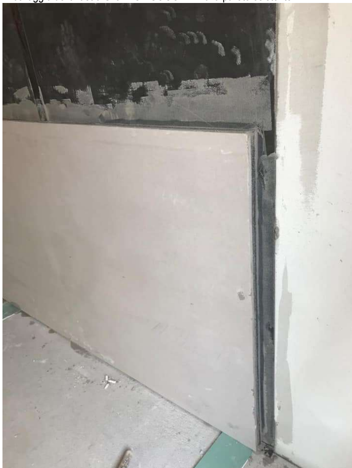
Incollaggio della lastra Silenz GIPSOGOMMA alla parete esistente