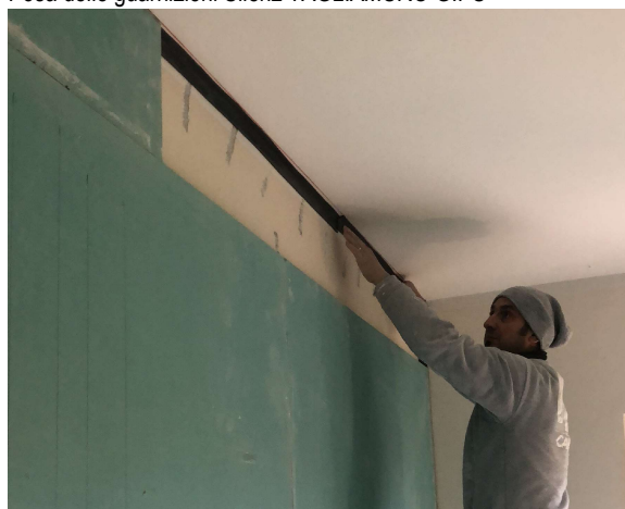
Posa delle guarnizioni Silenz TAGLIAMURO GIPS