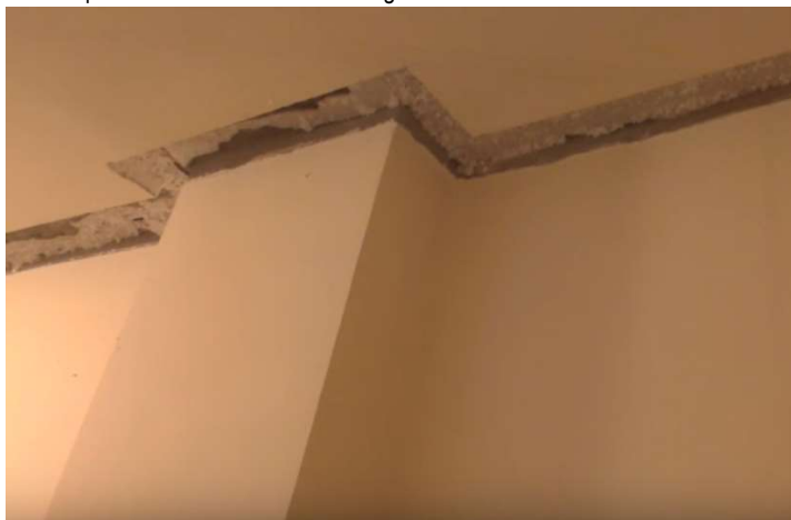
Fresata per creazione discontinuità tra gli ambienti